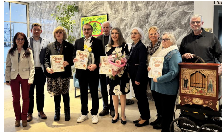
Vorstandschaft mit dem neugewählten Oberbürgermeister und den geehrten Mitgliedern