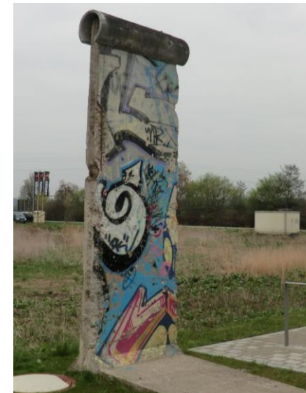
Original Berliner Mauerteil